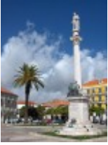
Estátua do Bocage - Mais detalhes

Cordenadas geográficas: 38.524318 ; -8.892659