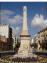
Monumento aos Combatentes da Guerra - Mais detalhes

Cordenadas geográficas: 38.529783 ; -8.895417