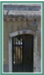
Rua General Daniel de Sousa - Mais detalhes

Cordenadas geográficas: 38.525087 ; -8.896240