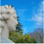
Busto Luísa Todi - Mais detalhes

Cordenadas geográficas: 38.524318 ; -8.892659