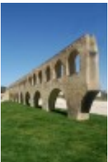
Aqueduto dos arcos - Mais detalhes

Cordenadas geográficas: 38.517734 ; -8.909204