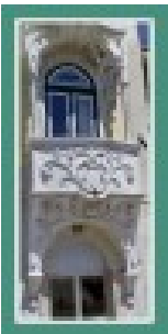
Av. Luisa Todi - Mais detalhes

Cordenadas geográficas: 38.530584 ; -8.898259